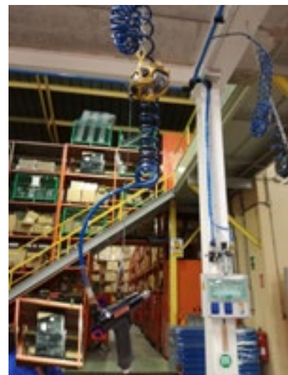
Figura 20.- Herramienta suspendida (Fuente: Estudio de campo).