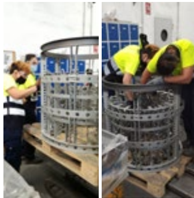
Figura 2.- Llenado de bastidor con arandelas, área externa e interna (Fuente: Estudio de campo).