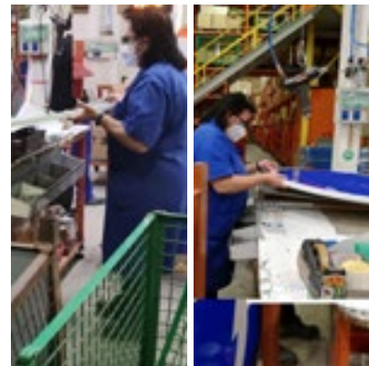
Figura 9.- Colocar pieza principal sobre las piezas (Fuente: Estudio de campo).