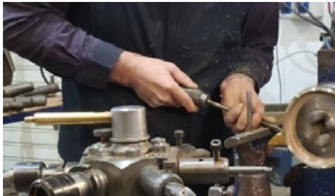
Figura 21.- Apoyo para trabajo con herramientas manuales.