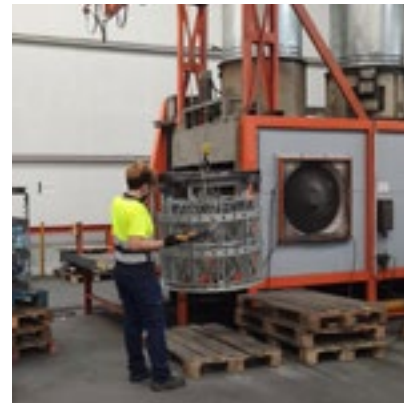
Figura 3.- Transporte de bastidor con grúa.