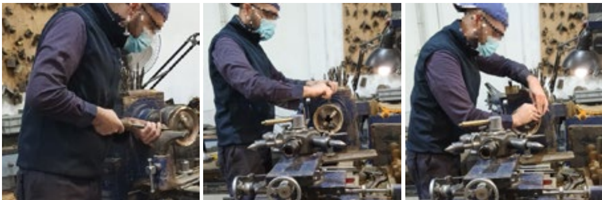
Figura 17.- Diferentes posturas adoptadas durante el trabajo en el torno.