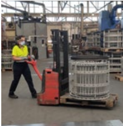
Figura 4.- Transporte bastidor lleno con pernos con transpaleta (Fuente: Estudio de campo).