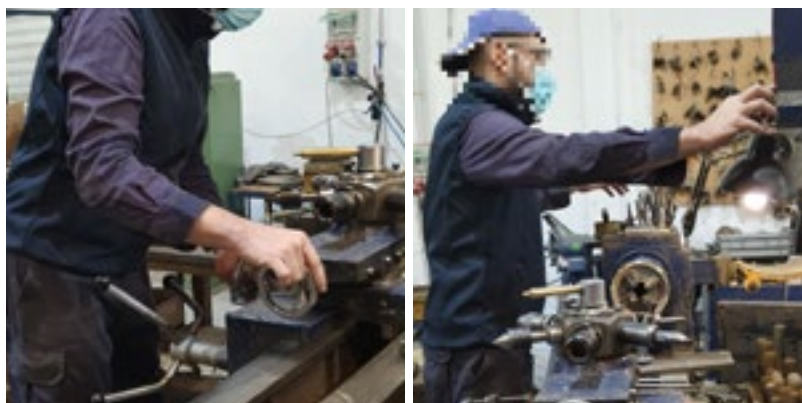
Figura 18.- Diferentes accionamientos de mandos y controles (Fuente: Estudio de campo).