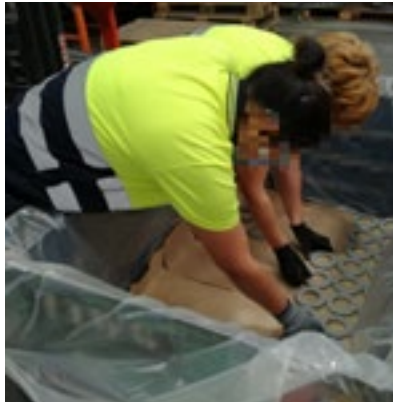
Figura 5.- Colocación arandelas tratadas en contenedor.