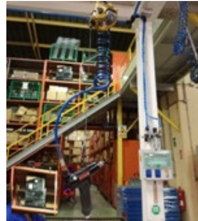
Figura 16.- Torno paralelo.