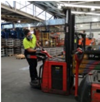
Figura 1.- Transporte con transpaleta eléctrica.