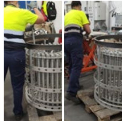
Figura 6.- Vaciado de bastidor de pernos tratados y colocación en superficie de trabajo

A continuación, se recogen una serie condiciones de trabajo en el puesto de carga y descarga de bastidores que podrían suponer un riesgo ergonómico, en especial, para las mujeres.