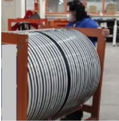
Figura 13.- Arrastrar carro lleno.