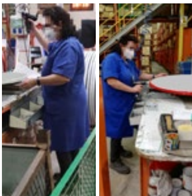
Figura 10.- Coger pistola y fijar piezas.