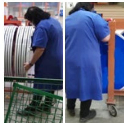
Figura 12.- Colocar pieza terminada en carro.