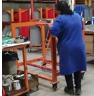
Figura 14.- Arrastrar carro vacío.