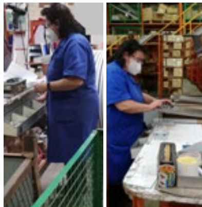
Figura 8.- Coger y colocar piezas metálicas.