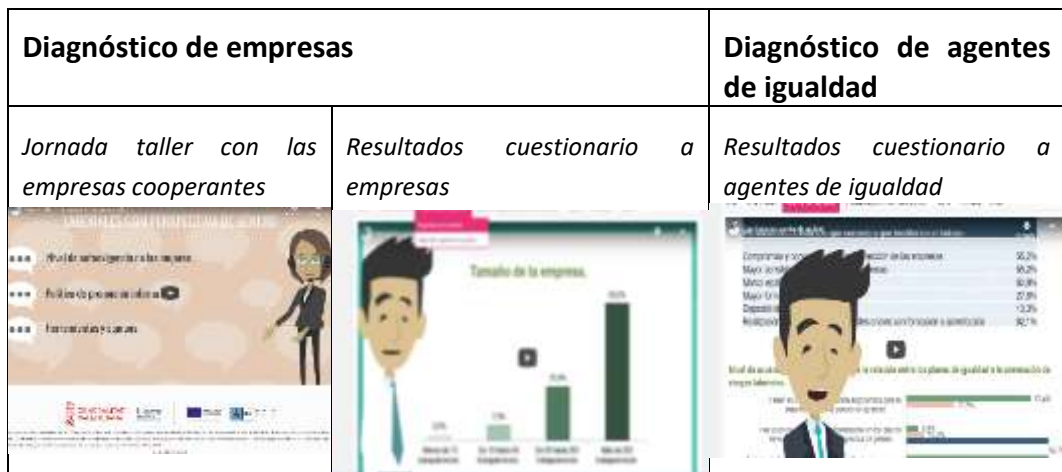
Figura 6. Pantallazos del contenido de la pestaña estado actual diagnóstico

En la pestaña Estado actual: Diagnóstico se incluyen tres vídeos: taller con empresas, cuestionario a empresas y cuestionario a agentes de igualdad. Estos vídeos son el resultado del análisis, para conocer el estado actual de la incorporación de criterios de género en la adecuación ergonómica en los entornos laborales, realizado con los agentes implicados mediante técnicas cualitativas y cuantitativas.