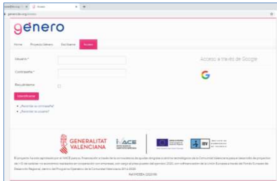
Figura 1. Pantallazo de la web con acceso restringido durante la evaluación del contenido.