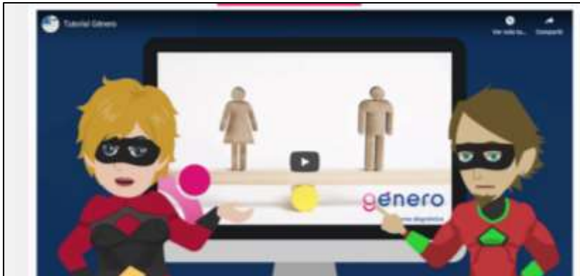
Figura 7. Pantallazo vídeo tutorial para realizar diagnóstico personalizado

En este vídeo se explica cómo cumplimentar la lista de comprobación y cómo generar el informe de diagnóstico personalizado.