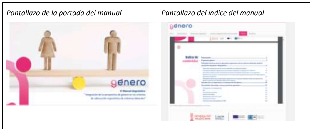
Figura 14. Pantallazo manual

Para finalizar se presentan prácticas en la adecuación de puestos de trabajo con perspectiva de género y bases documentales de normativa y legislación que es necesario conocer.