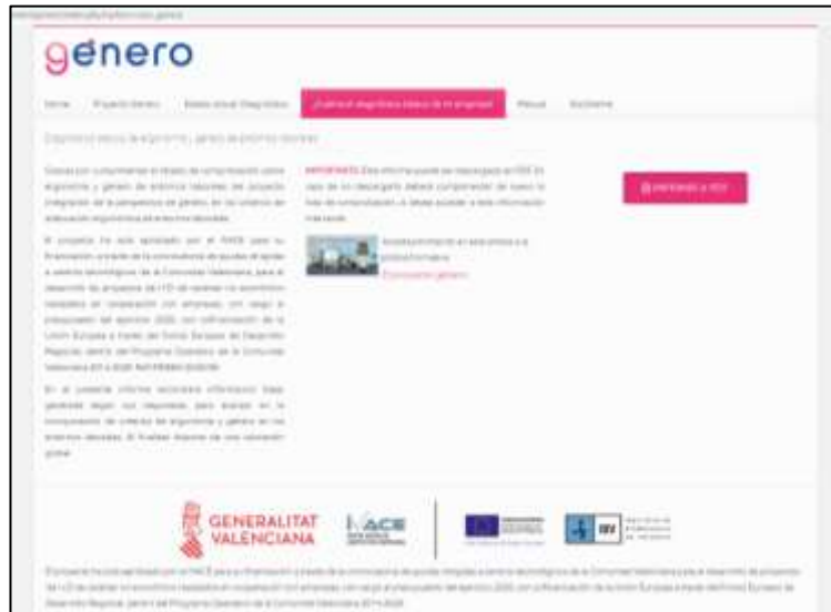
Figura 9. Pantallazo de sección para imprimir el diagnóstico básico.

Una vez se cumple la lista de comprobación se puede imprimir en PDF el informe de diagnóstico básico de la empresa.