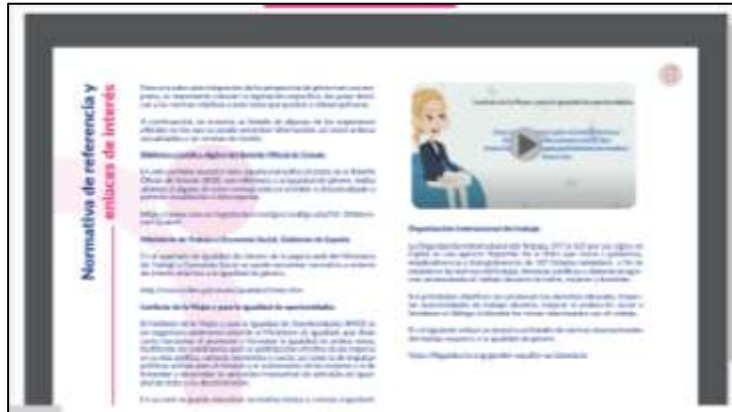
Figura 13. Pantallazo píldora informativa de normativa con enlaces de interés.

Con objeto de dar mayor visibilidad a la normativa aplicable, se ha implementado en este apartado la píldora informativa de normativa de interés que incluye descripción, enlaces de interés y vídeo explicativo.