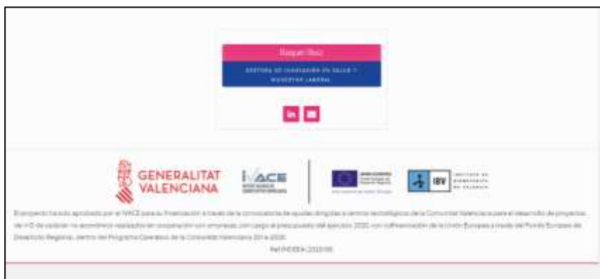
Figura 15. Pantallazo contacto con el IBV

Esta pestaña tiene como objetivo facilitar que las empresas que utilizan el manual o quienes quieran ampliar la información se pongan en contacto con el IBV. Se ha personalizado mediante el contacto directo con la gestora del proyecto.