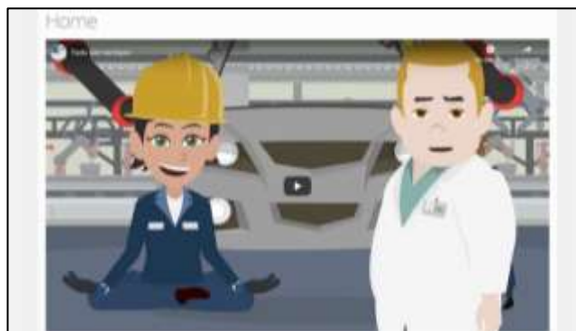
Figura 4. Pantallazo vídeo concienciación.

Este vídeo tiene como objetivo concienciar a las empresas sobre la importancia de tener en cuenta las diferencias fisiológicas y anatómicas entre las mujeres y los hombres en la adecuación ergonómica de los entornos laborales. La falta de adecuación de criterios ergonómicos a las características de cada sexo puede producir una discriminación desde la perspectiva de género.