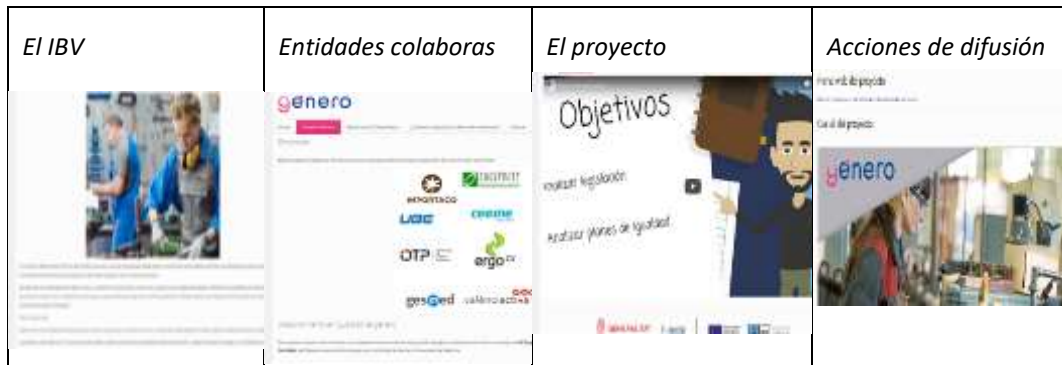
Figura 5. Pantallazos del contenido de la pestaña proyecto género.