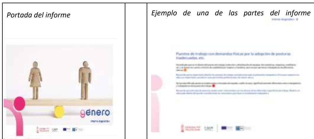
Figura 10. Pantallazo de portada informe de diagnóstico básico personalizado y de parte del diagnóstico.

El informe básico personalizado incluye: las respuestas a las preguntas que se ha realizado en la lista de comprobación, valoración con iconos positivos, neutros o negativos según las respuestas, píldoras informativas de cada uno de los aspectos valorados, y valoración global con dos posibles vídeos motivacionales, uno si la valoración es positiva y otro si es mejorable.