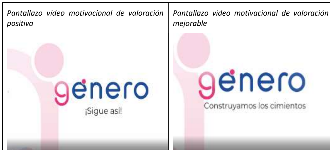
Figura 12. Pantallazo de vídeos motivacional tras la valoración global al hacer el diagnóstico

Al finalizar el informe se incluye una valoración positiva o mejorable en función de los resultados, con una frase y un vídeo motivacional.