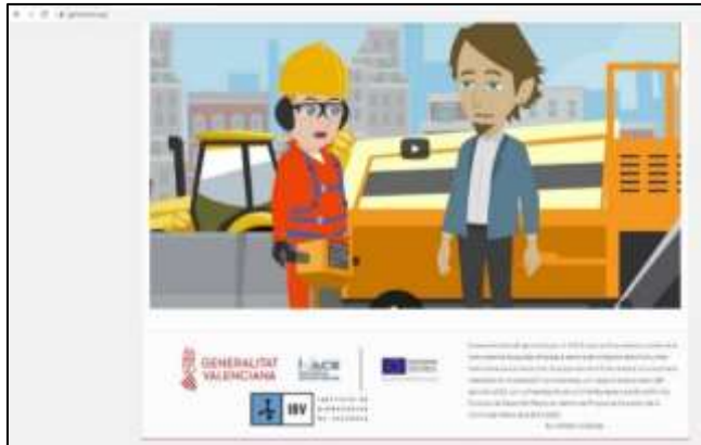
Figura 3. Pantallazo vídeo promocional-presentación.

Este vídeo tiene como objetivo promocionar y presentar los resultados del proyecto, por lo que su contenido se centra en mostrar el contenido de la web: manual de diagnóstico.