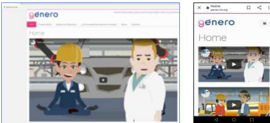
Figura 2. Pantallazo de home de la web, izquierda acceso desde ordenador y derecha desde teléfono móvil

La web es responsive, por lo que está preparada para ser utilizada en dispositivos, tipo PC, móvil inteligente, Tableta o similar.